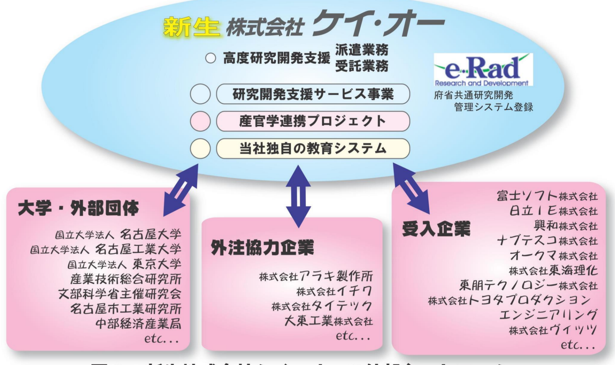
図3：新生株式会社ケイ・オーの外部ネットワーク

既存の技術者派遣サービス事業により培われ蓄積された専門的ナレッジを基礎に、提案型技術者による研究開発型支援サービス事業へのイノベーションを行います。