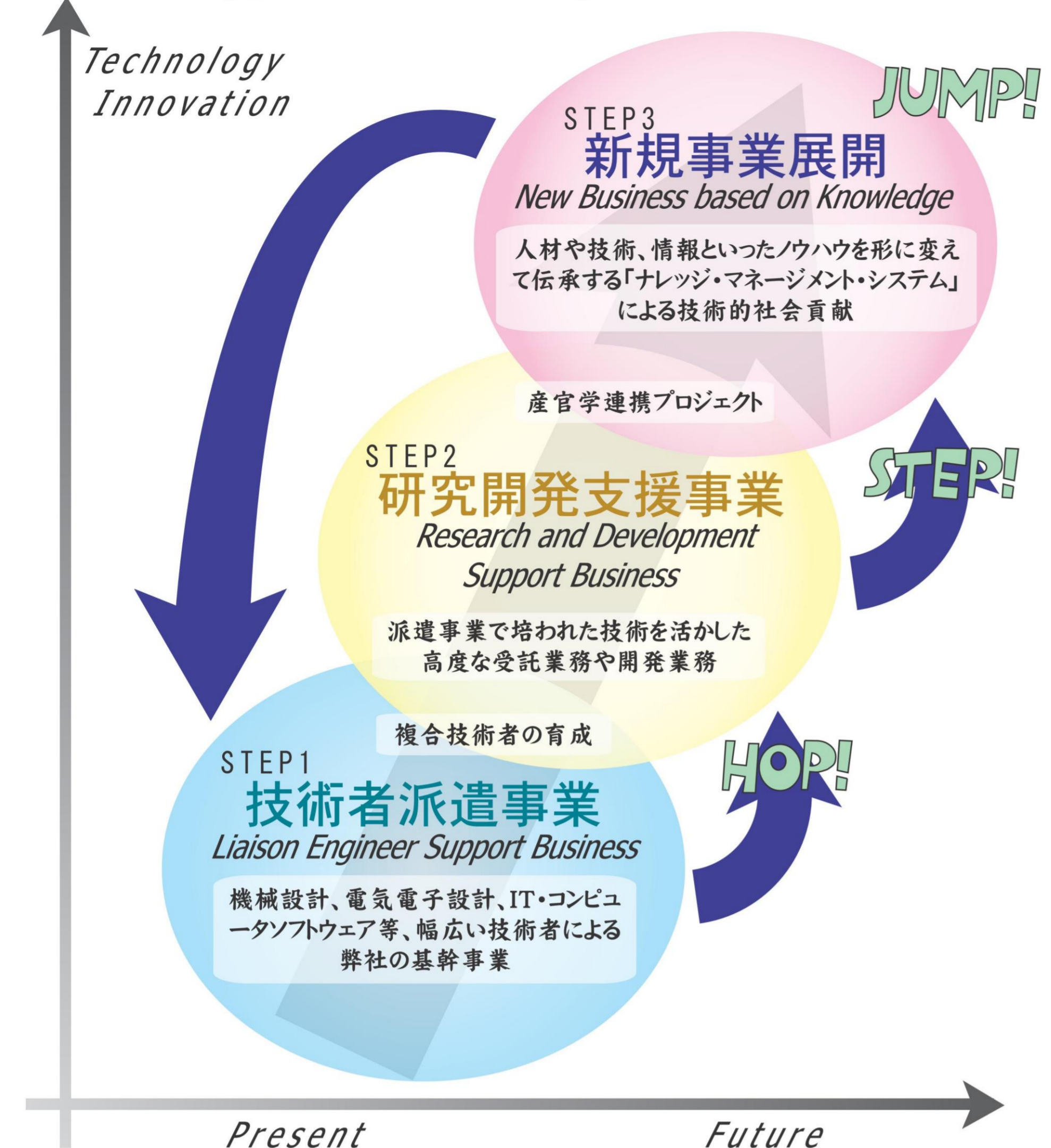
図4：新生株式会社ケイ・オー ステップアップ経営計画の概要

既存技術者派遣・受託業務【STEP1:HOP】から、高度専門技術者育成による研究開発型支援事業への展開【STEP2:STEP】と新規事業の確立【STEP3:JUMP】